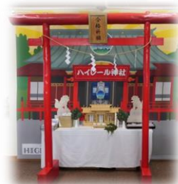
【ハイレール神社イメージ】