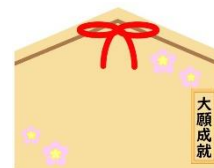
【紙製絵馬イメージ】

夢や目標を紙製絵馬に記入し、奉納いただける絵馬掛所を中込駅の「ハイレール神社」横に設置します。絵馬に書かれた夢や目標を応援していきます。 ※紙製絵馬はどなた様でもご記入いただけますが数に限りがございます